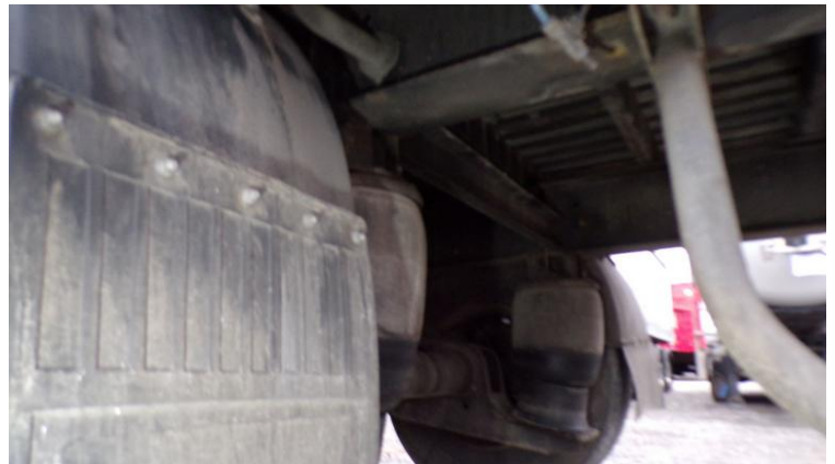
Fot. nr 88