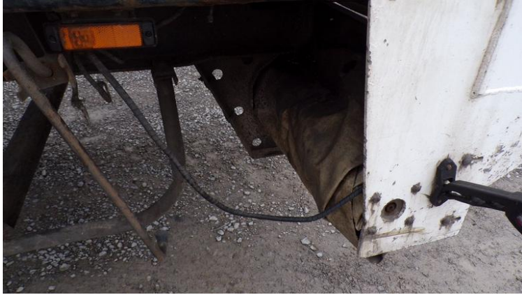
Fot. nr 79