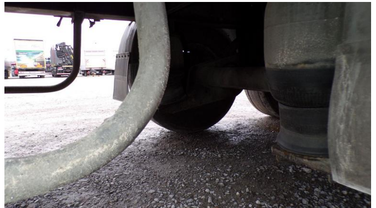
Fot. nr 82