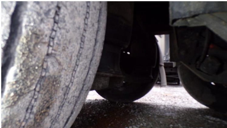
Fot. nr 87