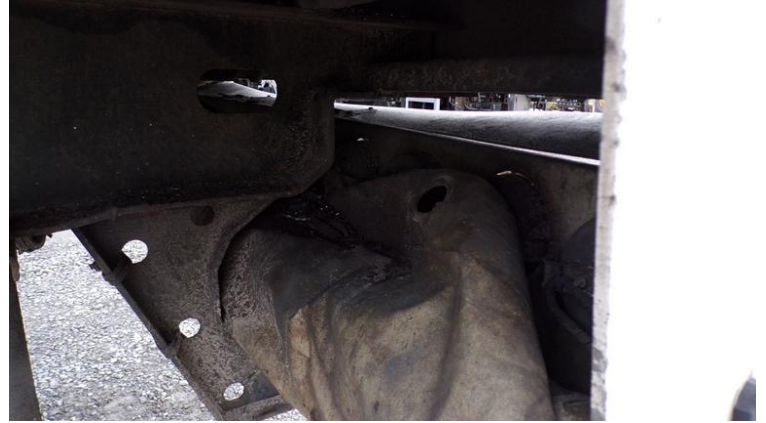
Fot. nr 80