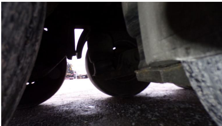
Fot. nr 83