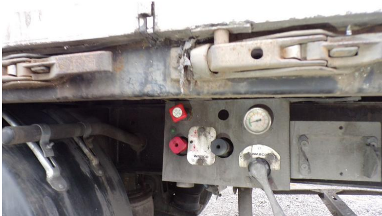
Fot. nr 77