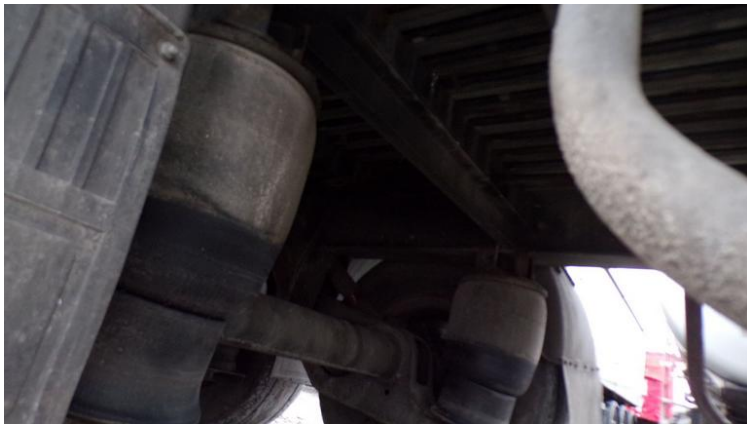
Fot. nr 81