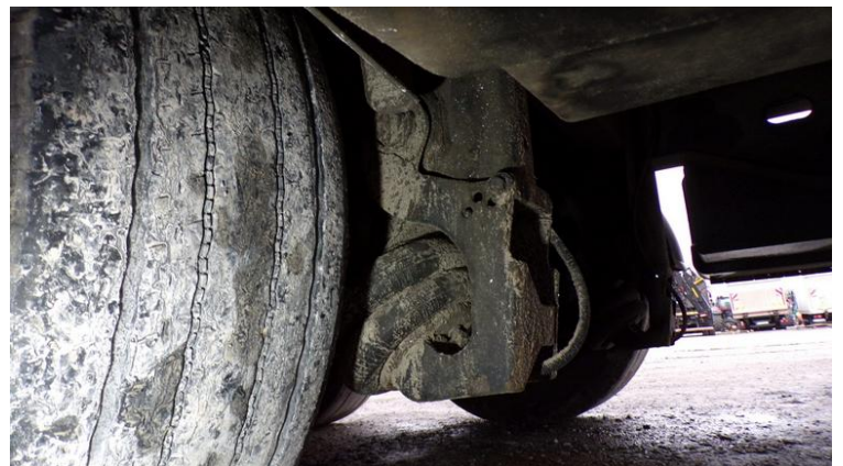
Fot. nr 84