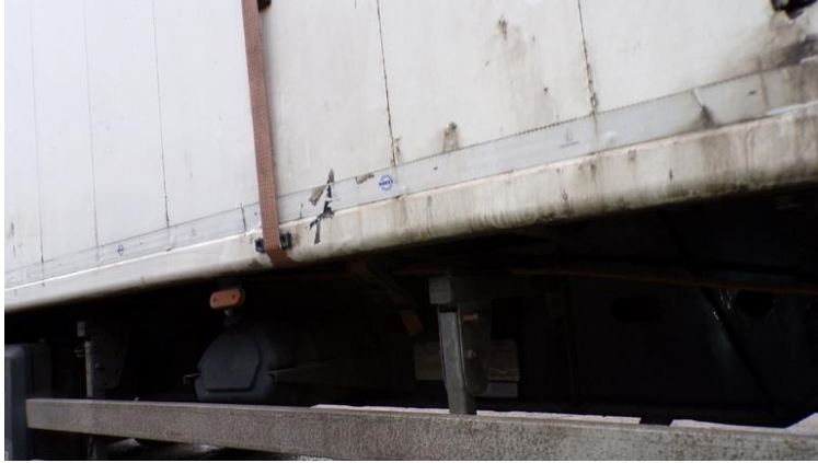
Fot. nr 85