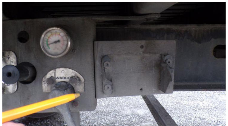
Fot. nr 90

Dokument wystawiony elektronicznie, wa ny bez podpisu