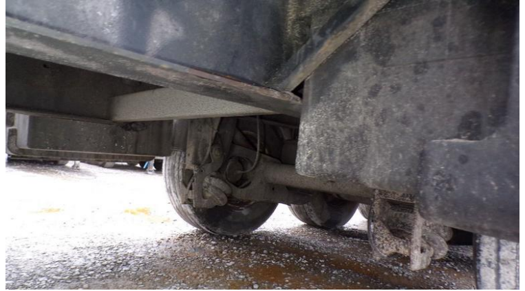
Fot. nr 86