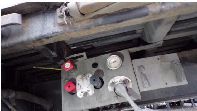
Fot. nr 89