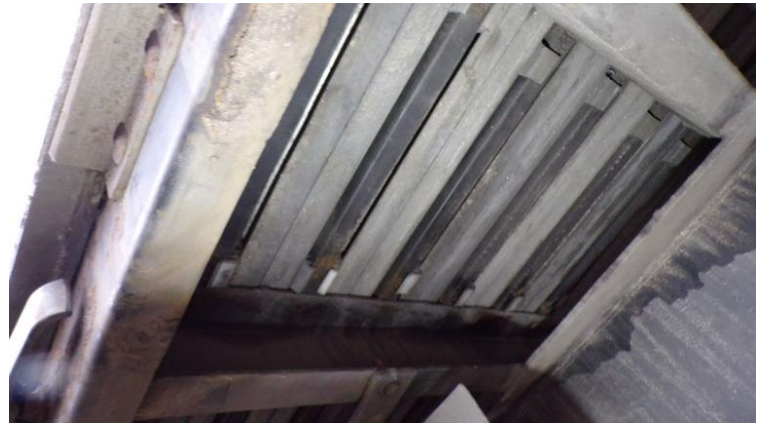
Fot. nr 78